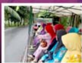
Lawatan Kerja Ke Nasuha Herbs & Paradise, Pagoh Muar, Johor MS 12