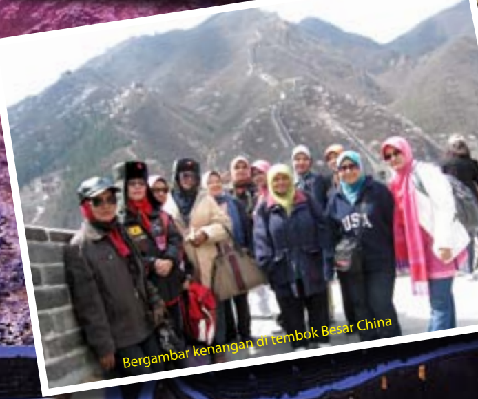
Bergambar kenangan di tembok Besar China