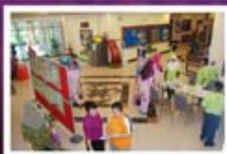
Seminar Kesihatan Ke Arah Wanita Unggul MS 9