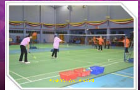
PUSPANITA vs BISTARI