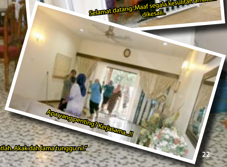
"Apayang penting? Kerjasama...!!"