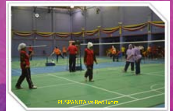
PUSPANITA vs Red Ixora