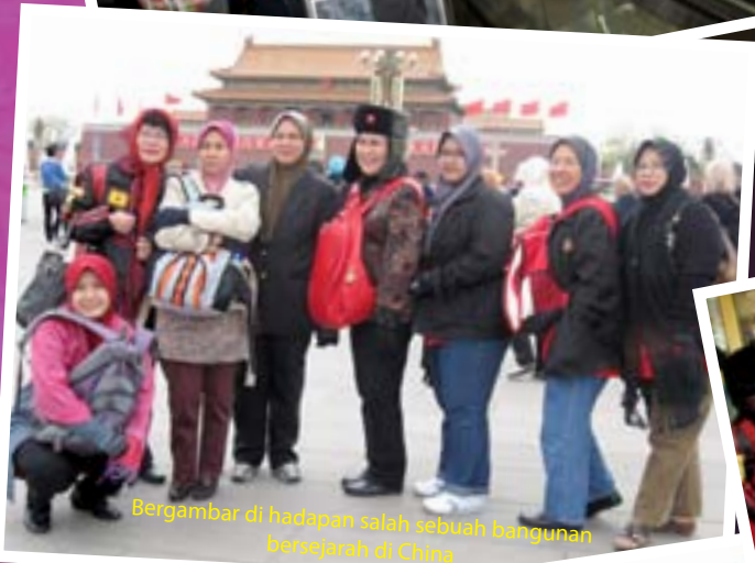
Bergambar di hadapan salah sebuah bangunan bersejarah di China