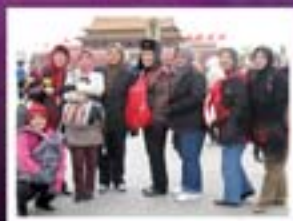
Lawatan Ke Luar Negara Beijing, China MS 14