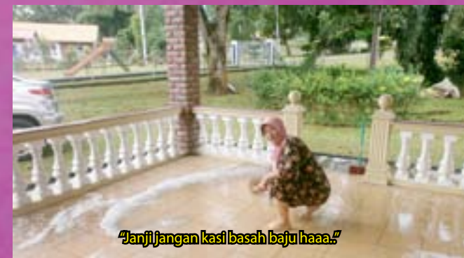
"Janji jangan kasi basah baju haaa."