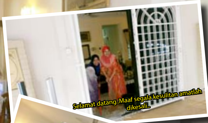
"Selamat datang..Maaf segala kesulitan amatlah dikesali.."