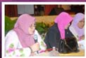
Mesyuarat Agung Puspanita Kali ke-29 Tahun 2011 MS 18